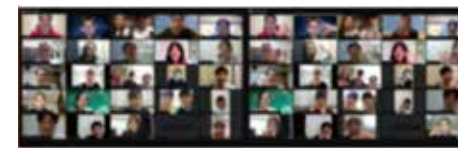
オンライン同窓会の様子

テーマ聖句：「神がキリスト・イエスによって上へ召して、お与えになる賞を得るために、目標を目指してひたすら走ることです。」(フィリピの信徒への手紙3章14節)