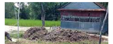
プレスクール建設予定地

JELAとLWDは共同で、カンボジアの将来を担う子どもたちのために、プレスクールの支援を継続していく方針です。カンボジア支援のために、引き続きお祈りとご支援をいただけましたら幸いです。