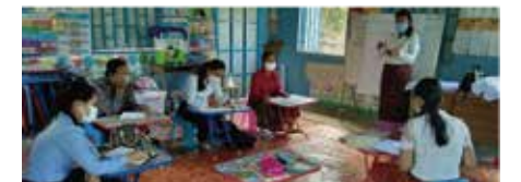
プレスクール建設・資金調達のための協議